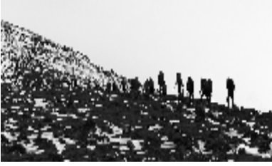
□ 21060401 牛博涛

冻土之上的黄梁原,我不止一次将她幻想成绿色。试想生机覆却了黄土,那三晋大地亦可比肩陌上天府。然而这是我的故土,改变她于心不忍,正视她又潸然泪下。山陵丘壑的地质,使她挽留不住这方水土。我有个想法,我可以在心底为黄土高原种下一片苍翠草原。